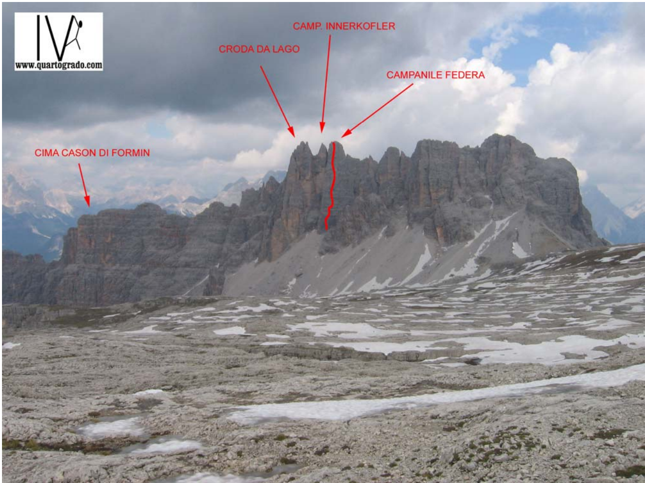
vista generale del versante ovest della Croda da Lago, con il Campanile Federa visto dai Lastoni di Formin